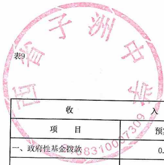
单位综合预算政府性基金收支表