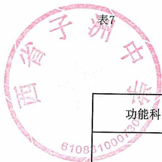
表7 单位综合预算一般公共预算基本支出明细表（按支出功能分类科目）