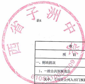
单位综合预算财政拨款收支总表