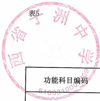
单位综合预算一般公共预算支出明细表（按支出功能分类科目）