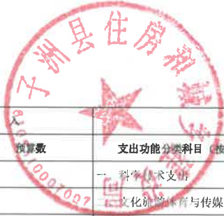
部门综合预算政府性基金收支表