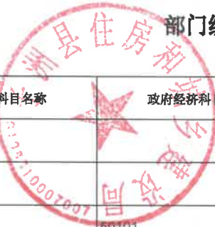
部门综合预算一般公共预算支出明细表（按支出经济分类科目）