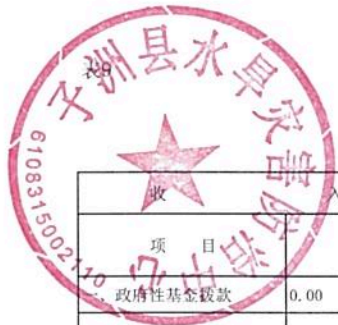
2024年单位综合预算政府性基金收支表