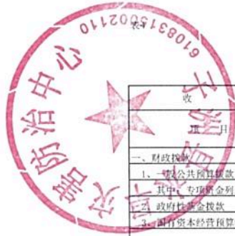
2024年单位综合预算财政拨款收支总表