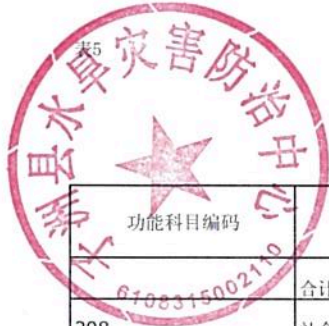
2024年单位综合预算一般公共预算支出明细表（按功能科目分）