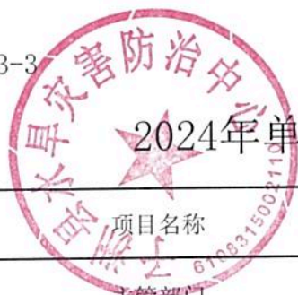
2024年单位预算专项业务经费绩效目标表