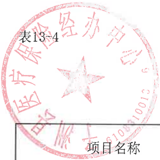
单位预算专项业务经费绩效目标表