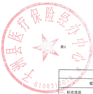
单位综合预算财政拨款收支总表