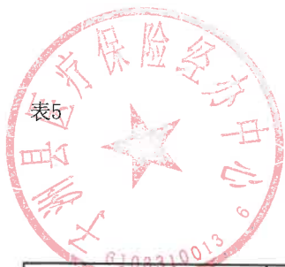
单位综合预算一般公共预算支出明细表（按支出功能分类科目）