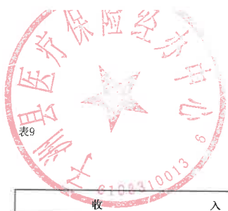
单位综合预算政府性基金收支表