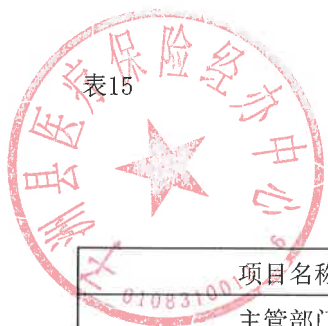
专项资金总体绩效目标表