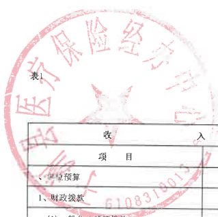
单位综合预算收支总表