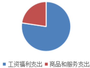
按部门支出经济分类