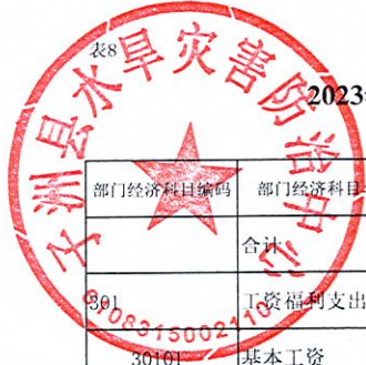
2023年单位综合预算一般公共预算基本支出明细表（支出经济分类科目）