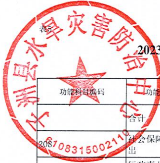
2023年单位综合预算一般公共预算支出明细表（按支出功能分类科目）