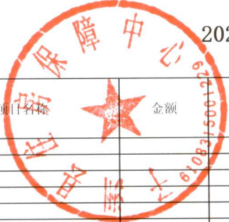
2022年部门综合预算财政拨款上年结转资金支出表