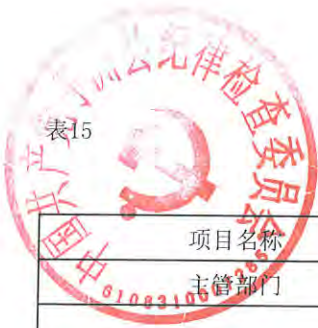
2023年专项资金总体绩效目标表