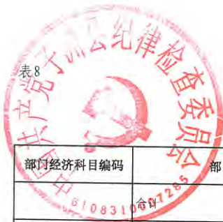
2023年部门综合预算一般公共预算基本支出明细表（按支出经济分类科目）