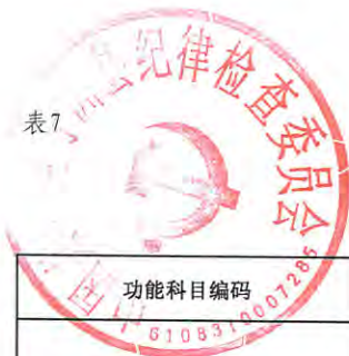
2023年部门综合预算一般公共预算基本支出明细表（按支出功能科目分类）