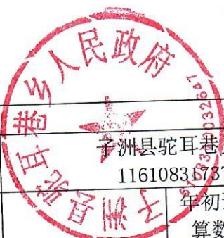
项目支出绩效自评表 (2022 年度)