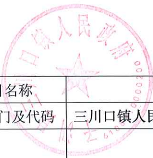
项目支出绩效自评表 (2022 年度)