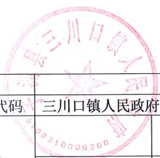
项目支出绩效自评表 (2022年度)